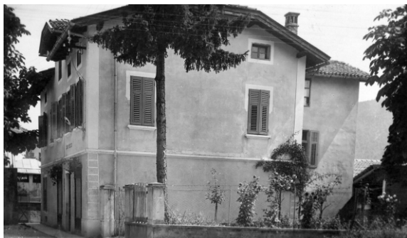
Hiša v Tolminu, kjer je Ljubkina mama odprla trgovino z mešanim blagom.

Ko sem dovršila meščansko šolo, sem stala nekako na razpotju. Kam naj grem. Na učiteljišče, ki smo ga imeli v Tolminu ali na trgovsko v Gorico, odločila sem se za trgovsko.